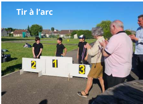
Tir à l'arc