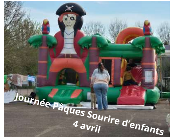
Journée Pâques Sourire d'enfants 4 avril