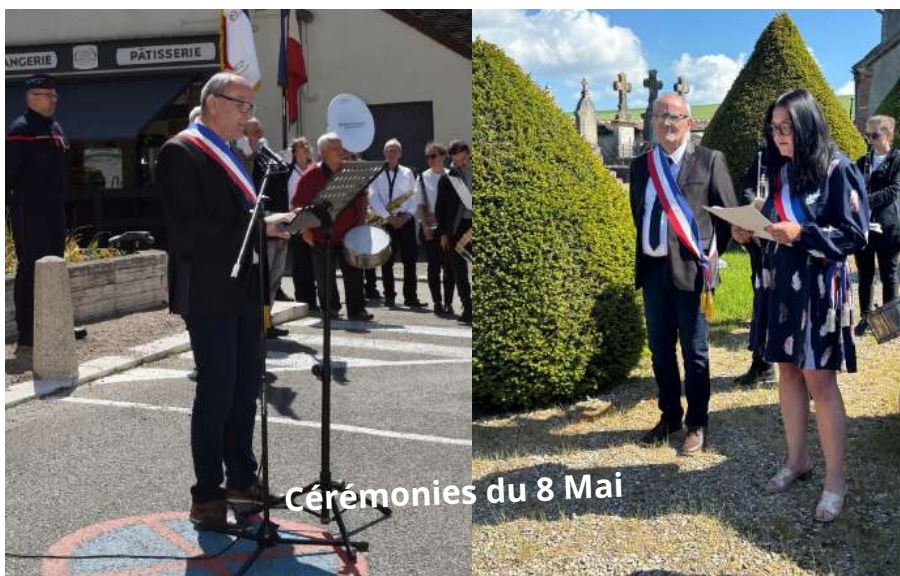
Cérémonies du 8 Mai