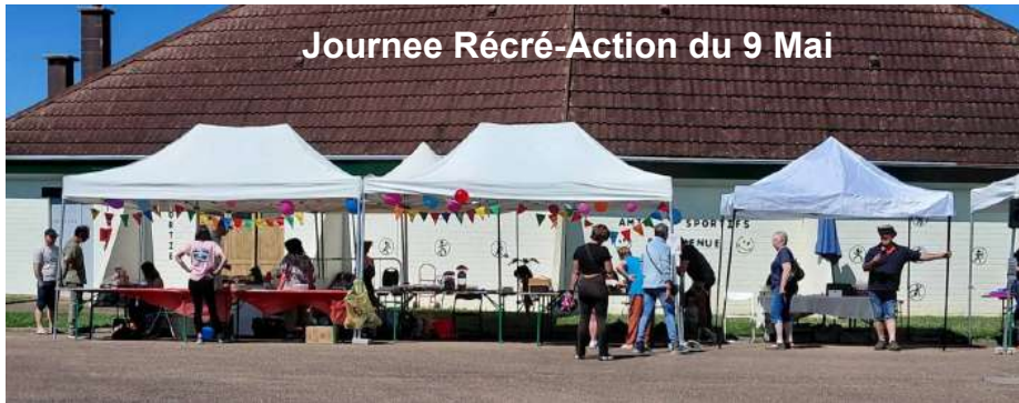
Journée Récré-Action du 9 Mai