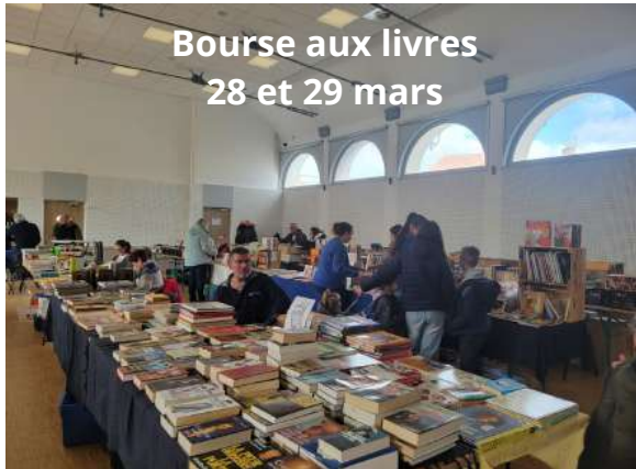
Bourse aux livres 28 et 29 mars