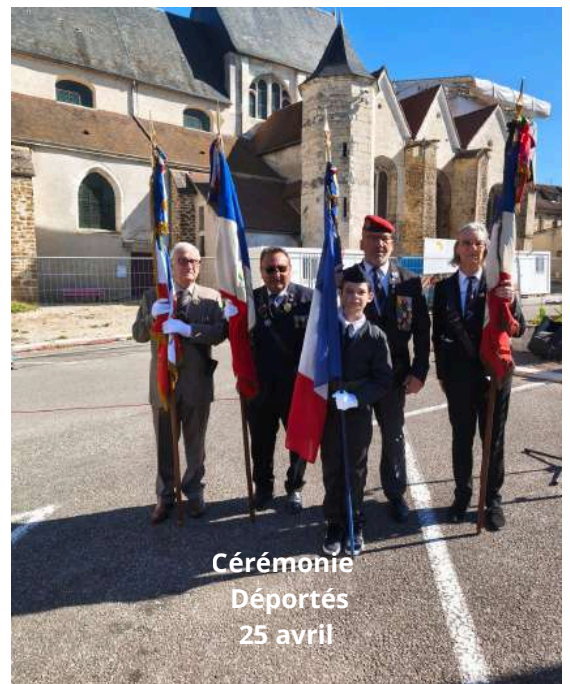
Cérémonie Déportés 25 avril