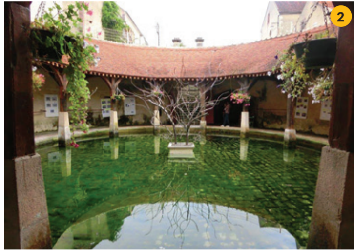
Lavoir de la Poterne