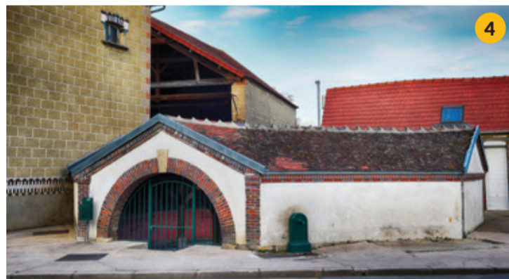
Lavoir du Port