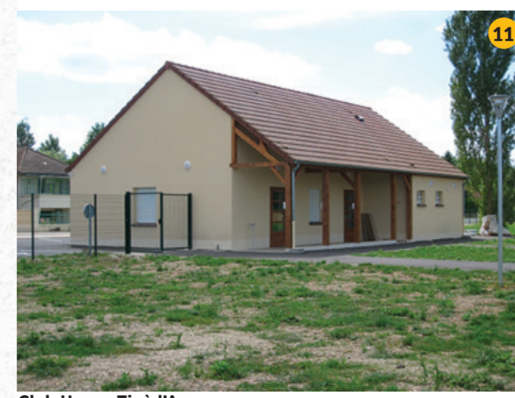
Club House Tir à l'Arc