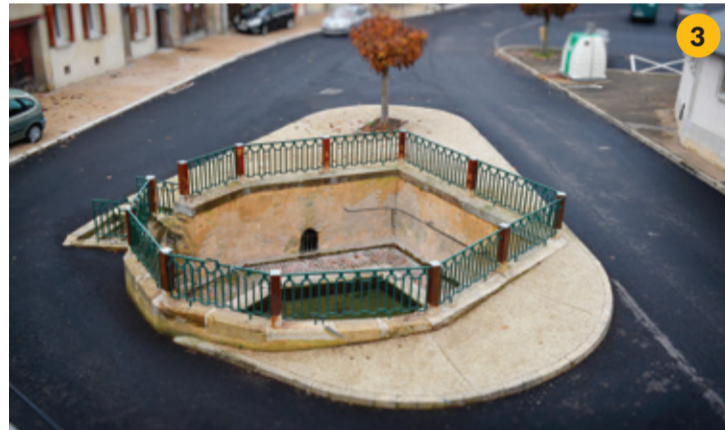
Lavoir Place Emile Drominy