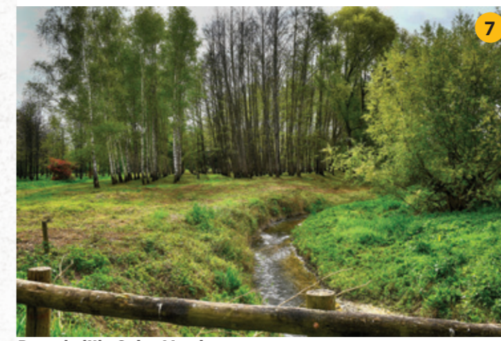
Parc de l'Île Saint Martin